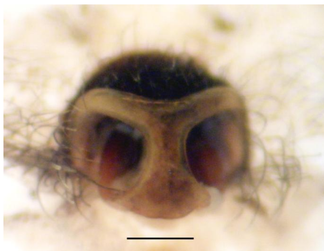
Figura 2. Epiginio de Argiope argentata (Fabricius, 1775). Escala: 0,5 mm.