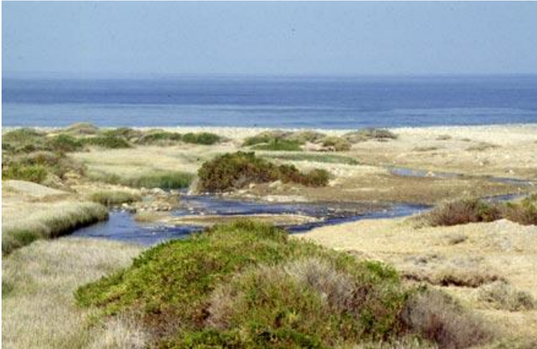
Figura 4. Habitat de Argiope argentata . Desembocadura del Río Lluta, Región de Arica y Parinacota, Chile. Figure 4. Habitat of Argiope argentata . Lluta river mouth , Arica and Parinacota Region , Chile.

por Uhl (2008) para esta especie, por lo que es conocida comúnmente en algunos lugares como la “araña de la cruz” (Figura 1).